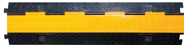
2 Kanal gerade