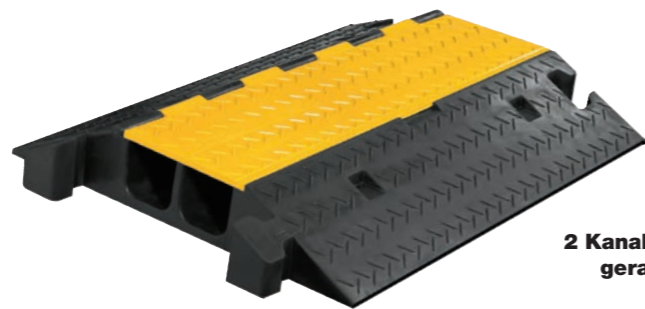
2 Kanal MAXI gerade

max. Belastbarkeit 200 kg, nicht für Schwerlastverkehr geeignet