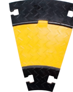
4 Kanal Bogen 30°