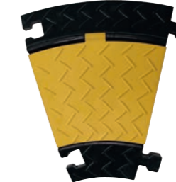
5 Kanal Bogen 30°