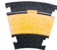
2 Kanal Bogen 30°