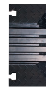
4 Kanal Endstück