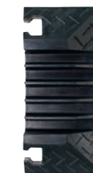
5 Kanal Endstück