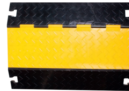
4 Kanal gerade