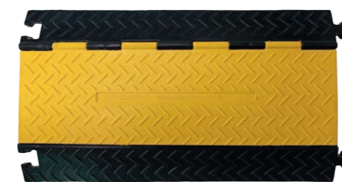
5 Kanal gerade