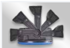
Etrier pivotable de 180°