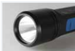
Diffuseur avec verre de sécurité