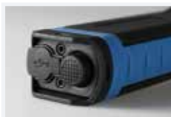
Interrupteur marche / arrête, prise USB