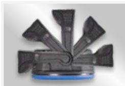
180° klappbarer Bügel