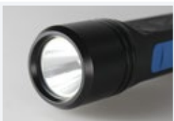
Lampenkopf mit Sicherheitsglas