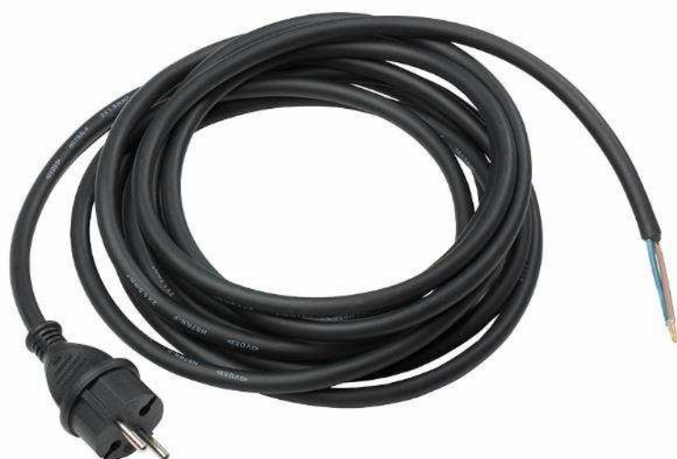
3m de câble H07RN- F 2x1,5, noir

Gaine extérieure en caoutchouc néoprène et isolant conducteurs en caoutchouc. Très résistant aux intempéries à l'ozone et à l'écrasement, il est particulièrement adapté à une utilisation soutenue en extérieur. Section Minimale de 2,5mm 2 obligatoire sur les chantiers en France et en Belgique. Reste flexible jusqu'à -30°C.